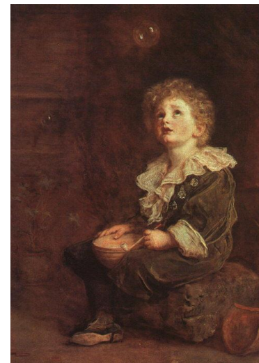
John Everett Millais Burbujas (1886)